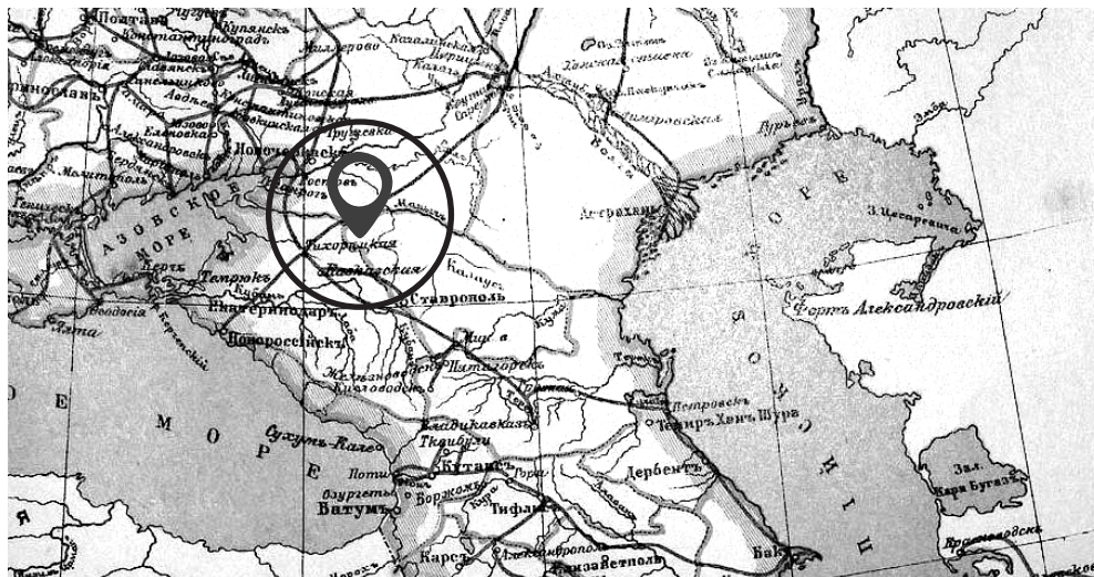
«Малый энциклопедический словарь Брокгауза и Ефрона». Начало XX в., ст. Тихорецкая - перекресток железных дорог.

ция Тихорецкая. Очень важный железнодорожный узел: место отхождения от двух весьма важных линий - на Новороссийск и на Царицын. Станция и разные устройства, сделанные на ее территории, образуют целый город с 10000 с лишком постоянных жителей, то есть служащих и их семей. Длина территории 3 версты, развездных и подъездных путей 43 версты. Имеются два паровозных вагонных здания на 50 стойл, мастерские службы пути. В 1895 году построен элеватор на 20000 четвертей хлеба. В поселке 15 мощных улиц с бетонными или асфальтовыми тротуарами, освещаемых керосинкальными и обыкновенными фонарями. Для постоянных жителей, служащих дороги, выстроены 164 жилых дома с садиками, а для отдыха временно приезжающих с поездами кондукторских и паровозных бригад - два особые здания. Дорога содержит два двухклассных училища, мужское и женское, приют на 100 чел. для сирот служащих железной дороги. Не забыты и хорошо удовлетворены потребности в разумных развлечениях, для чего существует железнодорожное общественное собрание, сад и построен целый ряд зданий - между прочим, двухэтажный клуб с концертным залом и сценой, библиотека-читальня, здание электробиографа.