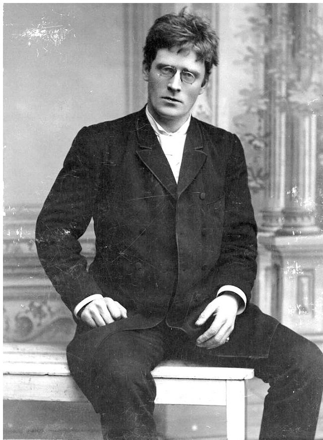
Норвежский писатель Кнут Гамсун (1859-1952).

В наши дни путеводители минувшей эпохи стали раритетными изданиями. А еще ценнейшим источником краеведческих знаний! Вслед за пассажирами наступил наш черед узнавать спустя столетие интересные подробности о станции Тихорецкой: «Стан-