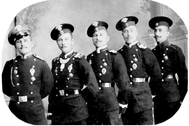
Нижние чины 13-го лейб-гренадёрского Эриванского Царя Михаила Федоровича полка.

в 1642 году при первом царе новой династии Романовых.