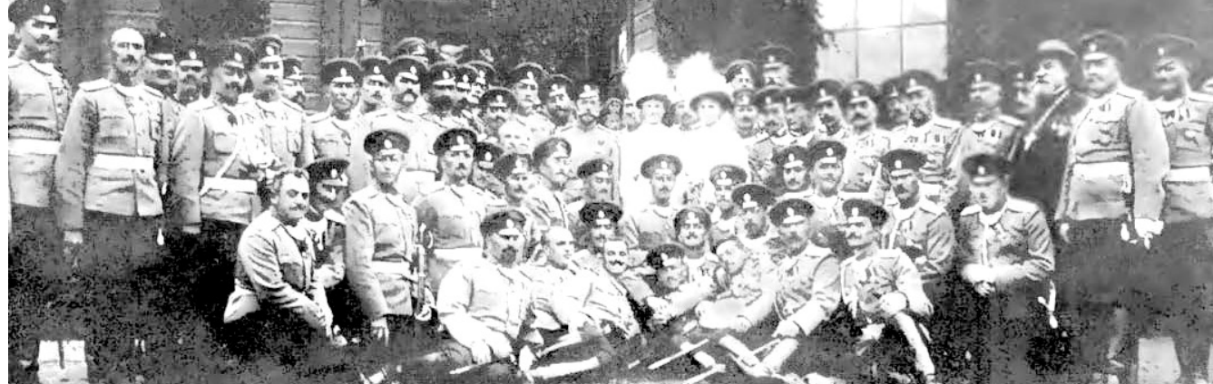
Царь и Царевны Великие Княжны Ольга Николаевна и Татьяна Николаевна среди эриванцев в Красном Селе в 1913 году.